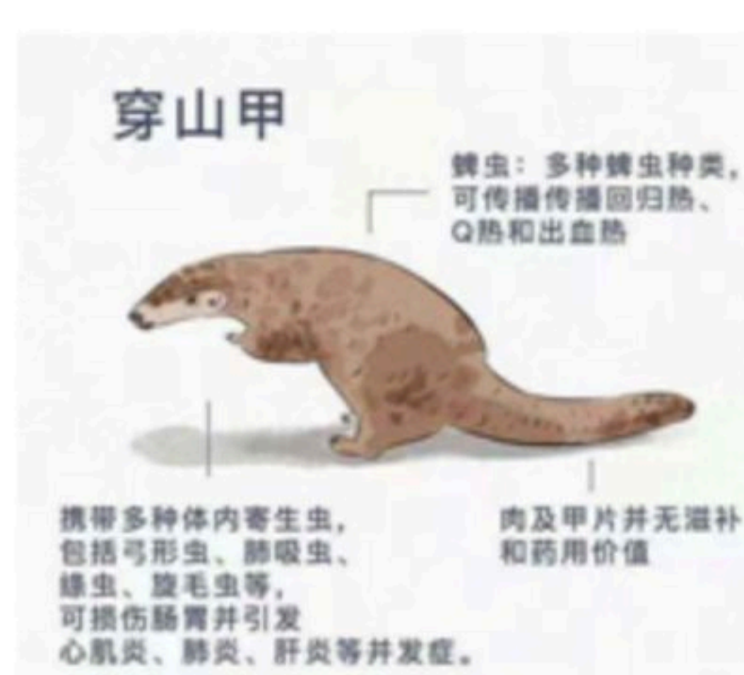
图二 穿山甲示意图

材料三：2020年3月3日是第七个世界野生动植物日，我国确定的主题为维护全球生命共同体—— ①人只要与自然和谐相处、与野生动植物共享美好的地球家园，才是符合生态文明的相处之道。 人与自然是一种共生关系，对自然的伤害最终也会伤及人类本身。 ②2月24日，十三届全国人大常委会第十六次会议通过决定，确立全面禁止交易，食用野生动物的制度，对违反现行法律规定的，要在现行法律基础上加重处罚。 保护野生动植物，就要保障它们的种群安全，珍惜其根植的土地和水源，保护其赖以生存的栖息地和食物链，乃至我们共同呼吸的空气。